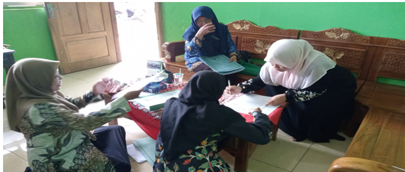
Gambar 2. Pertemuan Bersama Tim Pengawas “Kegiatan Evaluasi dan Perencanaan Pengintegrasian Kurikulum

seorang guru, kelompok MGMP Al-Azhar Mesir di madrasah mengadakan upaya terhadap pengembangan kurikulum.