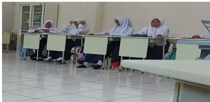
Gambar 3. Kegiatan Pengimplementasian Kurikulum Terhadap Siswa