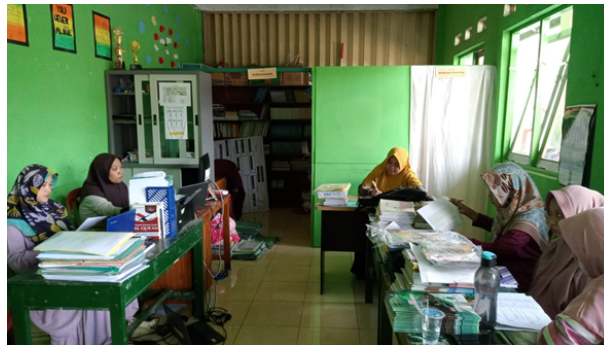
Gambar 1. Rapat Bersama Kamad , Comite dan Dewan Guru