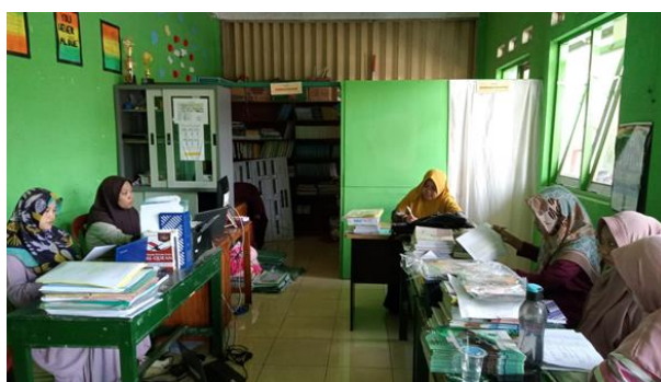
Gambar 1: Rapat Bersama Kamad , Comite dan Dewan Guru