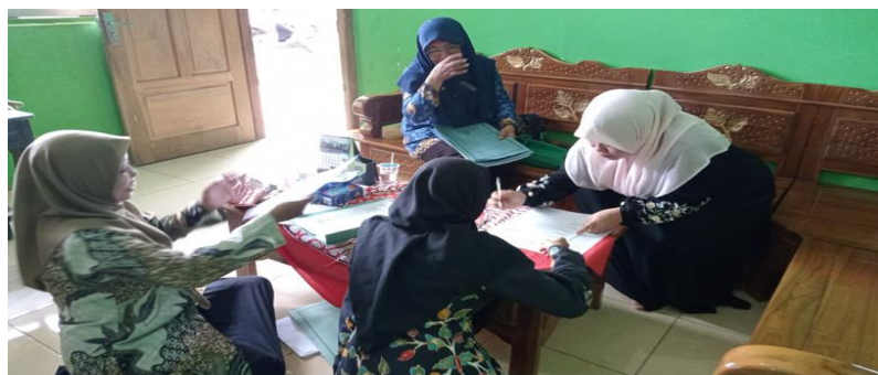
Gambar 2: Pertemuan Bersama Tim Pengawas “Kegiatan Evaluasi dan Perencanaan Pengintegrasian Kurikulum

Bisa disimpulkan model pengembangan kurikulum berbentuk administrative yang pertama digunakan dalam sistem pengelolaan kurikulum yang bersifat sentralisasi sedangkan model grass roots berkembang dari sistem pendidikan yang bersifat desentralisasi. Di dalam model tersebut seorang guru, kelompok MGMP Al-Azhar Mesir di madrasah mengadakan upaya terhadap pengembangan kurikulum.