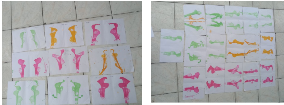
Gambar I. Hasil kegiatan mengembangkan kreativitas anak dengan media benang warna.

Gambar kegiatan dan hasil kegiatan meningkatkan kreativitas anak dengan metode benang warna yaitu: