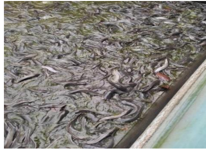
Gambar 2. Produk Ikan Lele Berakah Mandiri