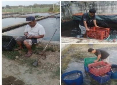
Gambar. 4 Sumber Daya Manusia Berkah Mandiri

penyortiran ikan lele. Hal ini membuat SDM memiliki pengetahuan, kemampuan dan keterampilan yang sesuai dengan pekerjaan yang dilakukan sehingga bisa untuk bekerja dengan baik, karena jika tidak tepat menghambat usaha yang menyebabkan kerugian.