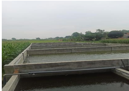
Gambar 5. Kolam Budidaya Ikan Lele Berkah Mandiri