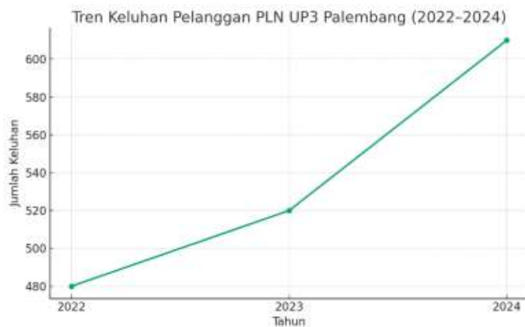
Gambar 1 Tren Kel PLN

Kepuasan pelanggan merupakan indikator utama keberhasilan penyelenggaraan pelayanan publik. Kotler dan Keller (2016) mendefinisikan customer satisfaction sebagai reaksi emosional yang muncul ketika pelanggan membandingkan ekspektasi dengan kinerja nyata produk atau layanan. Kepuasan terjadi jika kinerja melebihi ekspektasi, sedangkan kekecewaan muncul apabila kinerja berada di bawah harapan. Model SERVQUAL yang dikembangkan oleh Parasuraman et al. (2018) menilai kualitas pelayanan berdasarkan lima dimensi utama, yaitu keandalan, responsivitas, jaminan, empati, serta penampilan fisik.