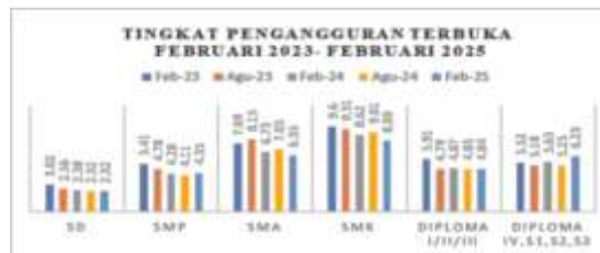
Gambar 1.1 Tingkat Pengangguran Terbuka Februari 2023 – Februari 2025

Tingkat pengangguran masih menjadi salah satu permasalahan serius yang dihadapi Indonesia hingga saat ini. Walaupun tren tingkat pengangguran terbuka (TPT) menunjukkan penurunan dalam beberapa tahun terakhir, masalah ini tetap menjadi isu strategis yang harus mendapat perhatian, khususnya pada kelompok lulusan perguruan tinggi (Badan Pusat Statistik, 2025).