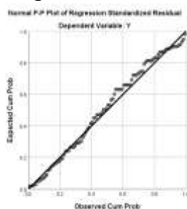
Gambar 2. Pengujian Normalitas

Hasil Uji Normalitas pada penelitian ini diperoleh sig sebesar 0,187. Data dapat dinyatakan berdistribusi normal jika nilainya lebih besar dari 0,05. Berdasarkan hasil tersebut dapat dinyatakan bahwa tiap variabel data telah berdistribusi normal karena nilai sig lebih besar dari 0,05.