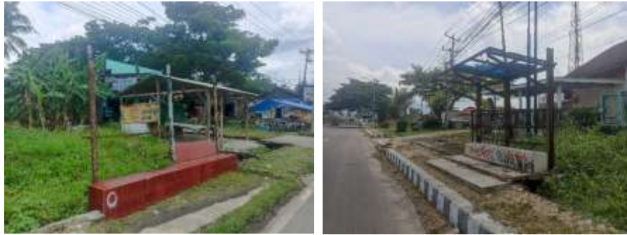
Gambar 4. Kondisi Halte Bus

Salah satu hambatan utama yang dirasakan oleh pengguna layanan adalah keterlambatan kedatangan bus sekolah. Keterlambatan ini berdampak pada ketepatan waktu kehadiran pelajar di sekolah dan menurunkan tingkat kepercayaan pelajar terhadap layanan bus sekolah. Kondisi tersebut diperparah dengan jadwal operasional bus sekolah yang hanya berlangsung tiga hari dalam satu minggu, yaitu pada hari Senin, Rabu, dan Jumat, sehingga pelayanan dinilai belum konsisten dalam memenuhi kebutuhan mobilitas pelajar setiap hari sekolah. Hambatan lainnya adalah keterbatasan jumlah armada bus sekolah. Saat ini, jumlah armada yang tersedia hanya sebanyak empat unit, sehingga rute pelayanan belum mampu menjangkau seluruh sekolah yang ada di wilayah Kabupaten Lampung Selatan.