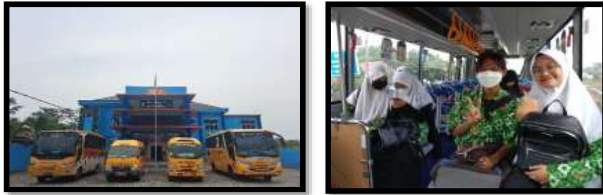
Gambar 2. Pelayanan Bus Sekolah