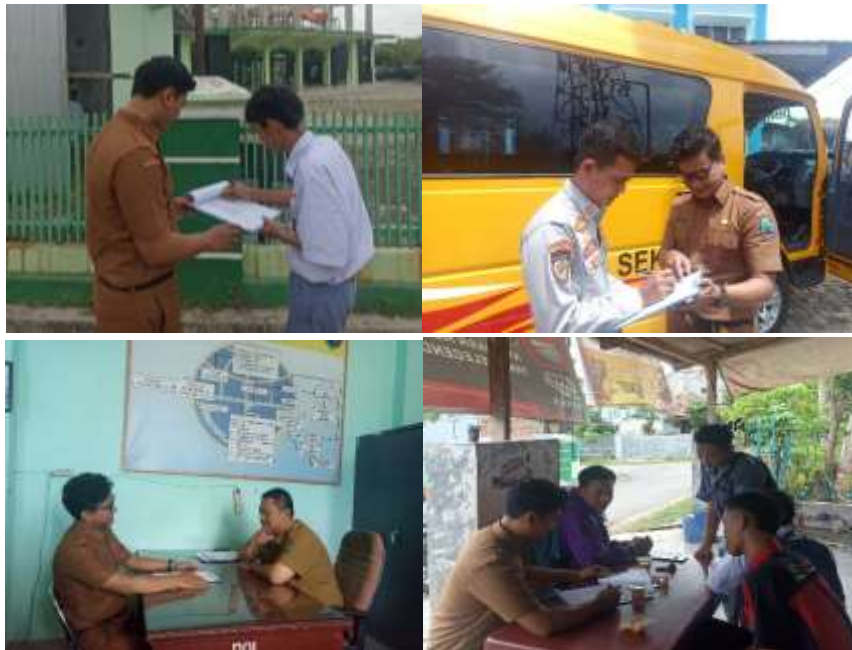
Gambar 3. Pelaksanaan Survei

Hasil kuesioner dan wawancara dengan pengguna layanan menunjukkan bahwa ketidakpuasan pelajar terutama berkaitan dengan aspek ketepatan waktu, waktu operasional, dan keterjangkauan rute pelayanan. Kondisi kualitas pelayanan bus sekolah di Kabupaten Lampung Selatan telah berjalan sesuai dengan ketentuan dasar pelayanan publik, namun belum sepenuhnya memenuhi harapan dan kebutuhan pengguna layanan. Keterbatasan armada, cakupan rute, serta waktu operasional menjadi faktor utama yang memengaruhi kualitas pelayanan dan tingkat kepuasan pelajar sebagai pengguna layanan. Berikut adalah dokumentasi pelaksanaan survei pengambilan data pelayanan Bus Sekolah di Kabupaten Lampung Selatan.