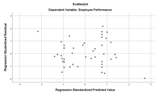
Gambar 2. Hasil Uji Heteroskedastisitas