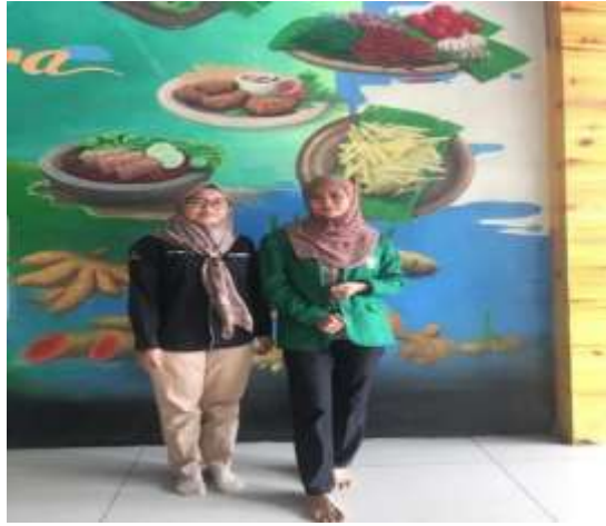
Gambar 1 Bersama Pendamping PKH Kerasaan I