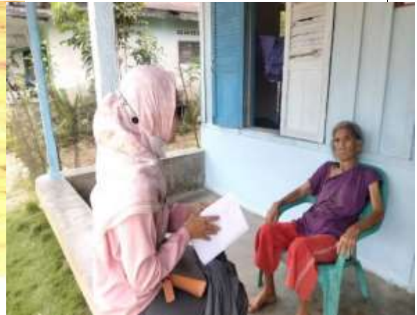
Gambar 2 Bersama Keluarga Penerima Manfaat