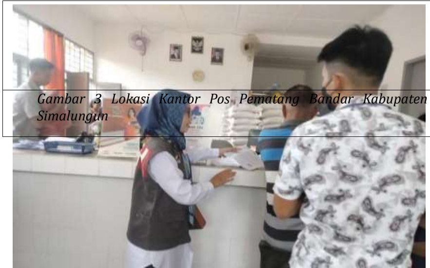
Gambar 3 Lokasi Kantor Pos, Pematang Bandar Kabupaten Simalungun