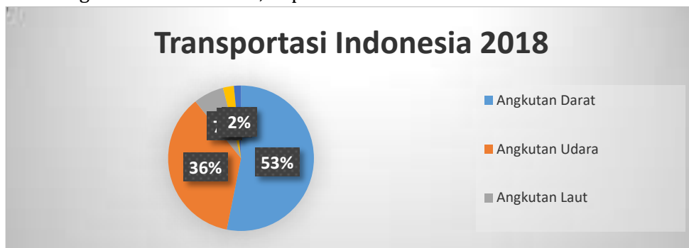
Gambar II. Transportasi Indonesia 2018

Analisis Supply Chain Indonesia (SCI) mengemukakan keadaan sektor transportasi Indonesia pada tahun 2018 yang mana dikuasai oleh sub sektor angkutan darat (jalan) yang berkontribusi sebanyak 53,15 persen dan kemudian selanjutnya angkutan udara sebesar 36,10 persen. Sedangkan beberapa angkutan yang lainnya berkontribusi kecil, diantaranya angkutan laut sebesar 6,77 persen, angkutan sungai, danau, dan penyeberangan berkontribusi 2,41 persen, dan yang terakhir angkutan rel sebesar 1,57 persen.