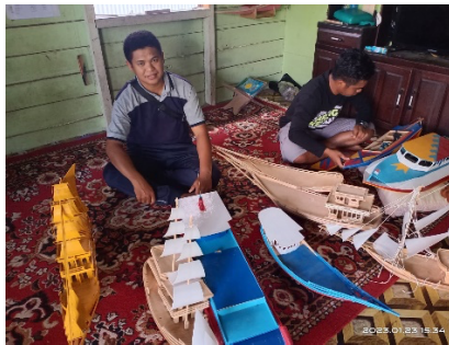
Gambar 7. Usaha Sovenir

Usaha dagang biji kopi dan bubuk kopi mulai tahun 2020 ketika dapat bantu dari BAZNAS sebesar Rp 3.000.000- Rama mulai mengembang usaha biji kopi. adapun alasan buka usaha tersebut karena banyak keberadaan Coffee di kabupaten Paser sehingga bayak harus membeli keluar kota sehingga memakan ongkos waktu, sehingga muncul ide untuk mendirikan usah jualan biji kopi target market adalah para pengusaha restoran atau Coffee . Omset pada awal hanya Rp300.000,- per bulan namun sekarang sudah berkembang dengan omset dapat mencapai Rp 10.000.000,-