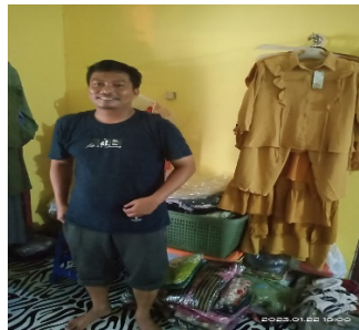
Gambar Error! No text of specified style in document.. Usaha Londri

Di bawah ini ditampilkan beberapa Mustahik yang mendapatkan bantuan berupa zakat produktif dari BAZNAS Kabupaten Paser sebesar Rp 3.000.000. adapun persyaratan yang mesti dipenuhi adalah berupa Profil usaha bagi usaha yang sudah berjalan atau rencana usaha bagi mustahik yang belum punya usaha. Di samping itu Calon mustahik juga diminta menyerahkan Kartu identitas diri berupa Kartu Tanda Penduduk dan Kartu Keluarga, sehingga persyaratan yang sangat mudah ini hampir semua orang yang berminat atau yang sudah berusaha dapat menerimanya.