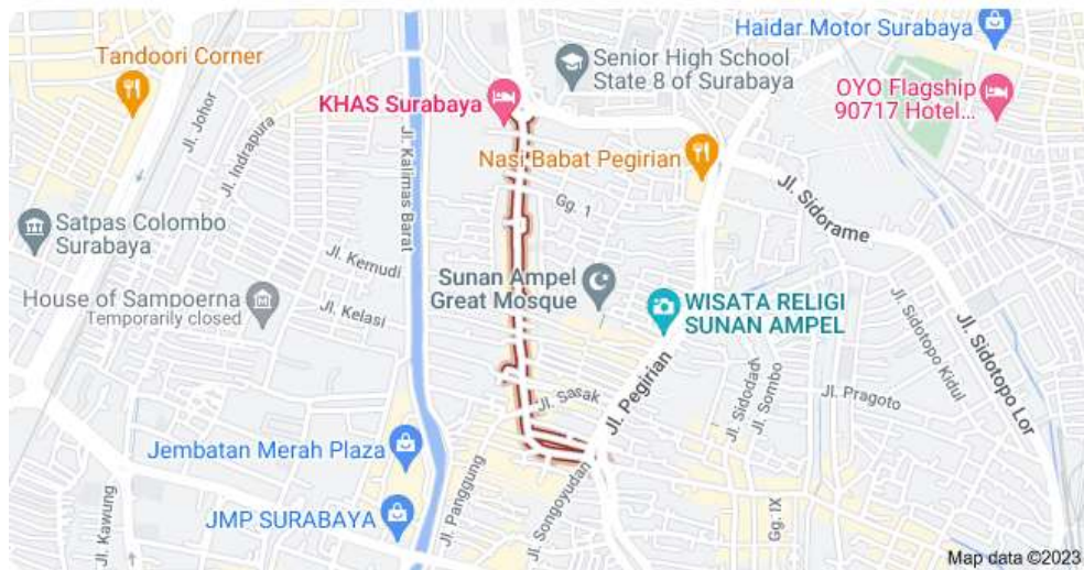
Gambar JL. KH. Mas Mansyur