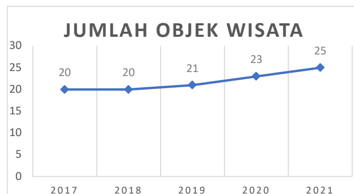
Gambar 4. Jumlah Objek Wisata yang Berada di Kabupaten Bangkalan Tahun 2017 - 2021

Kabupaten Bangkalan yang hanya memiliki beberapa hotel yang bisa dikatakan sangat sedikit dibandingkan dengan beberapa daerah lainnya. Namun bisa dilihat pada gambar 3 dimana jumlah kamar hotel yang ada jumlahnya belum stabil dari gambar grafik di atas jumlah tidak sama dalam 5 tahun, di tahun 2017 hanya memiliki 144 kamar namun di tahun 2018 dan 2019 jumlah tersebut mengalami kenaikan menjadi 169 kamar, namun mengalami penurunan ditahun 2020 dan 2021, dimana di tahun 2020 menjadi 125 kamar, 2021 menjadi 105 kamar. Penurunan ini diakibatkan oleh adanya COVID-19 dimana dalam kondisi ini pihak pengelola harus memangkas operasional yang ada dengan mengurangi jumlah kamar yang ada. Tingkat hunian hotel yang lebih tinggi akan memberikan dampak pada pendapatan hotel, yang diharapkan akan berdampak positif pada pendapatan asli daerah Kabupaten Bangkalan.