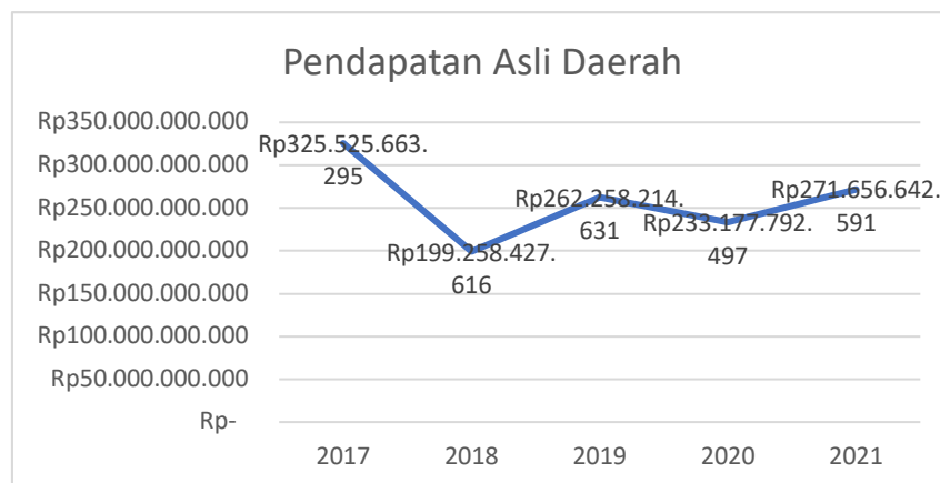
Gambar 1. Grafik PAD Kabupaten Bangkalan 2017-2021

Kabupaten Bangkalan adalah satu diantara empat Kabupaten yang berada di Pulau Madura yang memiliki banyak objek wisata alam. Kabupaten Bangkalan, yang terletak di ujung barat Pulau Madura, memiliki potensi untuk meningkatkan PAD melalui sektor pariwisata. Kabupaten Bangkalan memiliki wilayah yang bervariasi yaitu kondisi alam mulai dari dataran rendah hingga perbukitan kondisi ini tentunya menyediakan banyak tempat wisata sehingga dapat menarik wisatawan untuk berkunjung. Karapan sapi adalah salah satu ciri khas budaya masyarakat setempat yang sangat terkenal. Budaya ini ada dari ratusan tahun yang lalu dan masih diaga kelestariannya. Wisata dapat mendorong peningkatan Pendapatan Asli Daerah (PAD) Kabupaten Bangkalan.