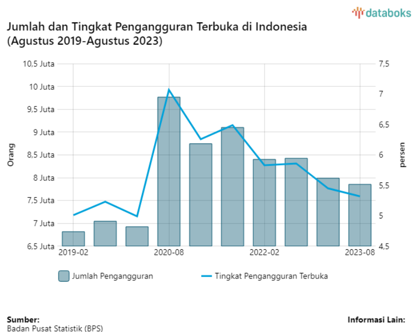
Gambar 2. Jumlah dan Tingkat pengangguran terbuka di Indonesia

Menurut (Faizah, 2019) globalisasi ekonomi memberikan dampak bagi kelangsungan usaha UMKM sehingga UMKM dituntut untuk terus memperbaiki diri agar dapat menghadapi persaingan yang semakin ketat terutama di era digital seperti saat ini. Banyak sekali tantangan yang dihadapi oleh usaha-usaha UMKM, namun untuk saat ini pengelolaan dana menjadi salah satu kendala yang dihadapi UMKM, baik karena kurangnya pengetahuan tentang pengelolaan dana atau Sumber Daya Manusia yang kurang memadai sehingga hal tersebut juga berdampak pada kegagalan UMKM itu sendiri (Kalsum et al., 2020). Laporan keuangan adalah sebuah ringkasan dari proses transaksi-transaksi keuangan yang terjadi selama periode pelaporan dengan tujuan agar dapat memberikan informasi mengenai posisi keuangan Perusahaan dan bermanfaat bagi para pengguna laporan keuangan untuk mengambil Keputusan, selain itu laporan keuangan juga merupakan sebuah pertanggungjawaban manajemen Perusahaan atas sumber daya yang sudah dipercayakan (Bahri, 2016).