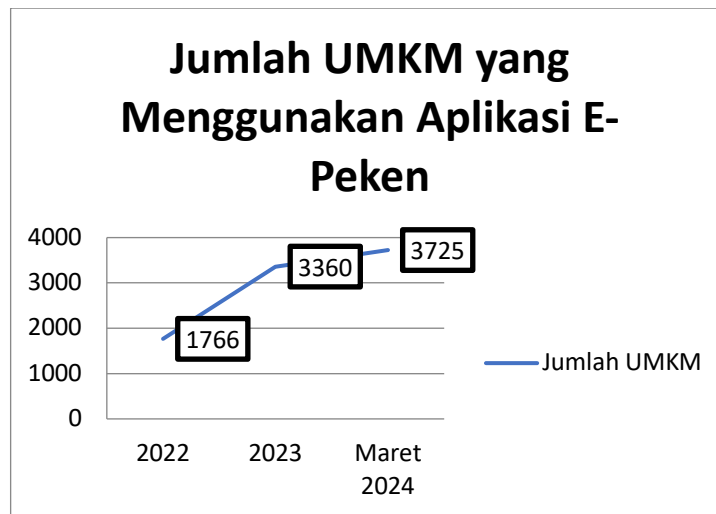
Gambar 2. Jumlah UMKM yang Menggunakan Aplikasi E-Peken

Pada grafik tersebut dapat dilihat bahwa adanya peningkatan jumlah pengguna khususnya para UMKM yang menggunakan aplikasi E-Peken. Pada tahun 2022 pengguna E-Peken berjumlah 1.766 orang, lalu pada tahun 2023 meningkat pesat dengan jumlah 3.360 orang, dan pada awal tahun 2024 yaitu bulan Maret pengguna masih meningkat dengan 3.725 orang UMKM yang menggunakan Aplikasi E-Peken. Dapat dilihat setiap tahunnya pengguna E-Peken mengalami peningkatan secara signifikan. Dengan hal ini, menandai bahwa Aplikasi E-Peken memberikan manfaat bagi para pelaku UMKM sehingga banyak yang tertarik sehingga mendaftar dan menggunakan E-Peken untuk mempromosikan dan menjual produk mereka.