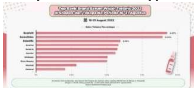
Gambar 3. Serum terlaris 2022 di Shopee dan Tokopedia pada 16-31 Agustus 2022.

berada di urutan pertama sebagai Brand serum terlaris di Shopee dan Tokopedia sehingga berada di posisi kedua setelah scarlett menempati posisi pertama, dan skintific di posisi ketiga. Dengan tren dan perubahan dinamis dalam industri kecantikan, Studi ini akan mengeksplorasi pengaruh dari Brand Ambassador, khususnya melalui fenomena Korean Wave, memengaruhi minat pembelian konsumen terhadap produk Somethinc.