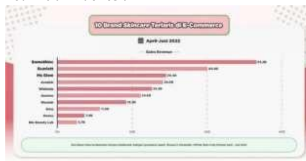
Gambar 1. merek perawatan kulit yang paling laris di platform e-commerce selama periode April-Juni tahun 2022.

Berkembangnya banyak produk kosmetik baru, baik dari luar maupun dalam negeri, menyebabkan persaingan di industri kosmetik menjadi semakin sengit. Salah satu Brand asal Indonesia yang berkecimpung dalam sektor bisnis ini adalah Somethinc. Somethinc adalah Brand asal Indonesia yang didirikan pada Mei tahun 2019. Merek Somethinc telah meluncurkan produk perawatan kulit dan makeup yang telah terdaftar di BPOM serta telah memperoleh sertifikasi halal. Dikutip dalam berita (compas.co.id) Somethinc menjadi produk lokal terlaris No. 1 di E-commerce pada Tahun 2022 di ikuti oleh produk Scarlett di posisi ke dua dan Ms Glow di posisi ke tiga. Hal ini menandakan tingginya minat beli pada produk Skincare Somethinc di Indonesia.