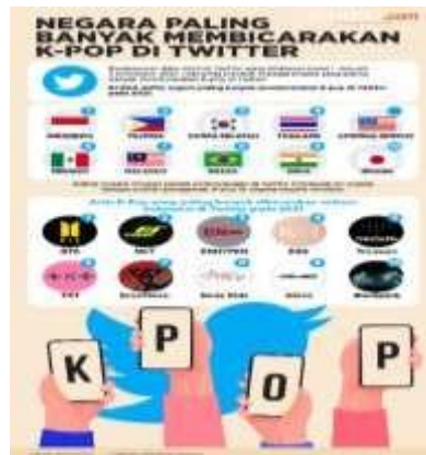
Gambar 2. Negara yang paling aktif membicarakan tentang K-pop di platform Twitter.