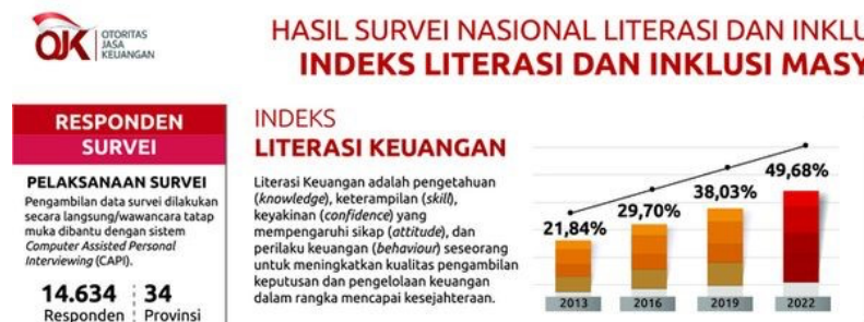
Gambar 2. Indeks Literasi Keuangan Nasional

Faktor kedua dalam penelitian ini yang diduga mempengaruhi pengelolaan keuangan pribadi siswa adalah literasi keuangan. Menurut Otoritas Jasa Keuangan (OJK) literasi keuangan adalah suatu proses untuk meningkatkan pengetahuan, keterampilan, dan keyakinan masyarakat luas dalam pengambilan keputusan dan mengelolaa keuangan agar menjadi lebih baik. Literasi keuangan ini sangat penting bagi masyarakat Indonesia hal ini didukung dengan kegiatan Survey Nasional Literasi dan Inklusi Keuangan (SNLIK) yang dilakukan oleh OJK.