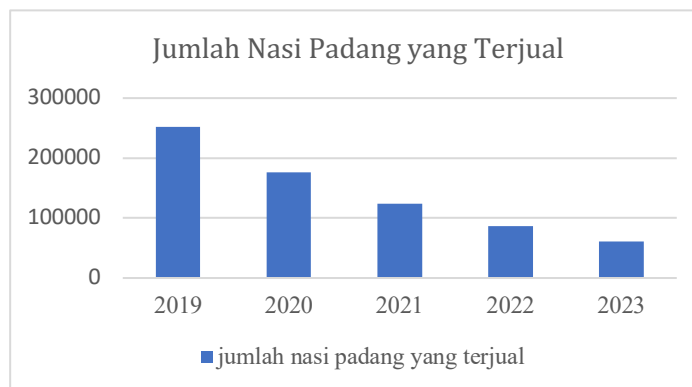
Gambar 1. Jumlah Nasi Padang yang Terjual

Hasil observasi pada salah satu pelaku usaha rumah makan nasi padang yang tutup gerai disebabkan oleh kinerja usaha yang kurang baik yaitu kurangnya pemanfaatan waktu dalam proses produksi, selain itu harga bahan baku nasi padang juga mengalami kenaikan sehingga mempengaruhi harga jual. Hasil observasi lain tertuju kepada lima pelaku usaha rumah makan nasi padang yang masih bertahan hingga saat ini namun penghasilannya semakin menurun dari tahun 2019 hingga tahun 2023.