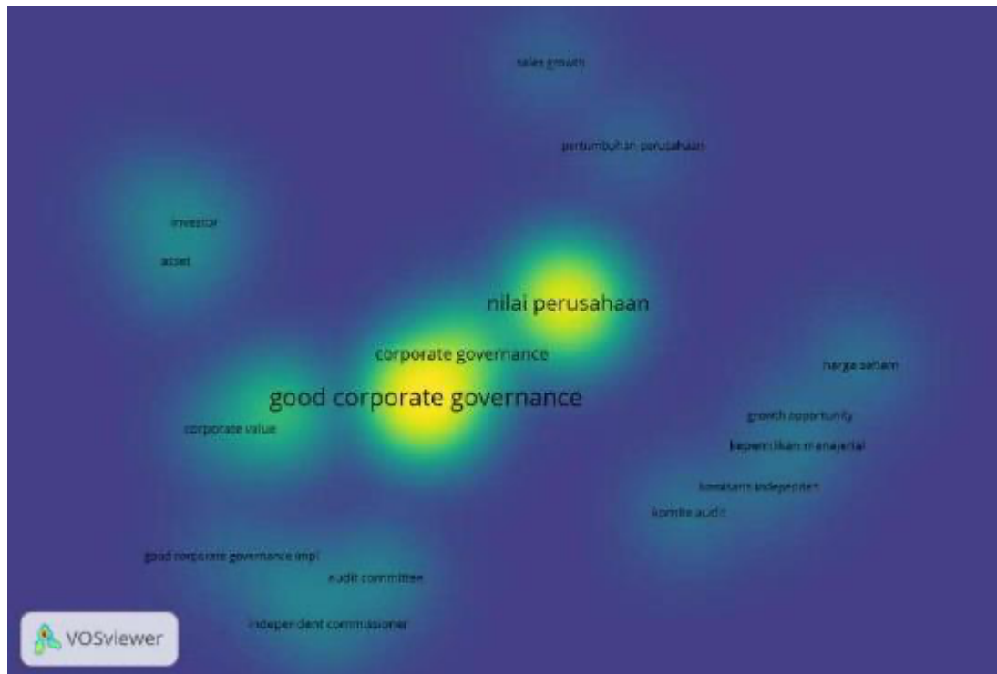
Gambar 2. Kemunculan Kata Kunci Penulis Secara Bersamaan