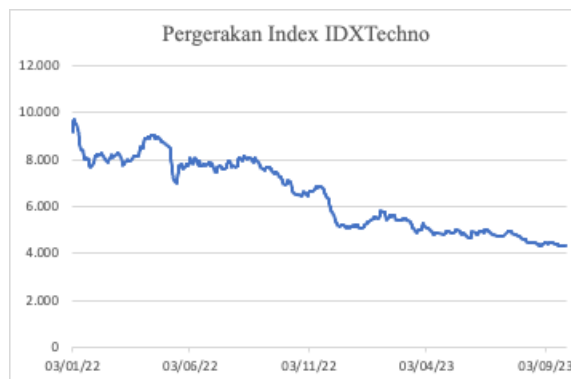
Gambar 1. Fluktuasi Index Saham IDX Techno Q1 2022-Q3 2023

Sektor teknologi pada pasar saham merupakan sektor baru yang menarik banyak minat para investor karena sektor ini dipercaya sebagai sektor yang memiliki prospek baik di masa depan dan juga banyaknya sentimen positif bagi sektor teknologi (Hidayat & Jubaedah, 2022). Hal ini disebabkan karena adanya pertumbuhan ekonomi digital yang merupakan salah satu pilar pertumbuhan ekonomi dunia. Di Indonesia, pertumbuhan sektor teknologi disebabkan karena adanya pertumbuhan penggunaan internet yang pesat dan adanya dukungan pemerintah dengan mengeluarkan berbagai kebijakan untuk mendukung pengembangan ekonomi digital. Lahirnya berbagai perusahaan Start-up teknologi hasil karya anak bangsa seperti Bukalapak dan GOTO juga menjadi faktor pendukung dalam pertumbuhan sektor ini. Kendati demikian, kenyataan di lapangan menunjukkan bahwa perusahaan pada sektor teknologi tidak selalu mengalami peningkatan dalam aspek nilai pasar perusahaan. Hal ini dibuktikan dengan turunnya index saham teknologi IDX atau IDXTechno dari kuartal pertama tahun 2022 hingga kuartal ketiga 2023 yang disajikan pada gambar berikut: