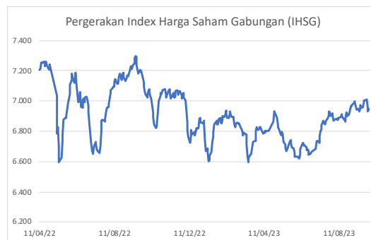
Gambar 2. Pergerakan IHSG Q2 2022 - Q3 2023

Jika ditinjau dari Index Harga Saham Gabungan atau IHSG, index gabungan ini bergerak lebih fluktuatif dibanding IDXTechno. Hal ini disebabkan karena IHSG mencakup seluruh saham yang terdaftar di BEI, dibandingkan dengan IDXTechno yang hanya mencakup saham perusahaan teknologi. Karena IHSG merupakan index gabungan seluruh saham BEI, maka sentimen pasar dapat menjadi dampak dari fluktuasi karena berbagai sentimen baik positif maupun negatif dari berbagai sektor dan emiten tergabung menjadi satu sehingga dapat mempengaruhi IHSG secara keseluruhan. Dilansir dari CNBC Indonesia (2023a), pada tanggal 10 Februari 2023, saham emiten teknologi beramai-ramai terkapar di zona merah pada perdagangan hari tersebut. Turunnya saham Big Cap di sektor tersebut membuat kinerja IDXTechno menjadi buruk pada hari tersebut. Imbasnya, IHSG pun ikut turun pada hari tersebut hingga 0,25% setelah sebelumnya sempat terjun lebih dari 1% hingga jeda sesi 1 pada hari tersebut.