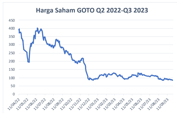
Gambar 3. Pergerakan Harga Saham GOTO Q2 2022 - Q3 2023