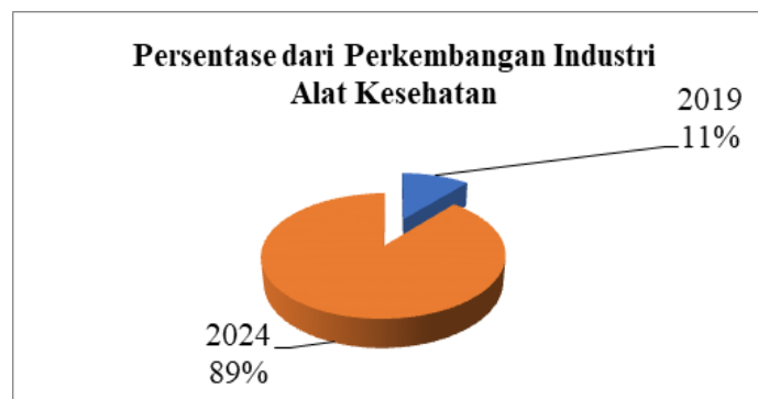
Gambar 1. Diagram Persentase dari Perkembangan Industri Alat Kesehatan

Permintaan terhadap produk-produk halal semakin meningkat di kalangan masyarakat. Dapat dilihat pada Tabel 1, bahwa per 8 Desember 2023, jenis alat kesehatan yang bersertifikasi halal telah ada sebanyak 56 produk, dengan jumlah 921 produk. Dalam dunia bisnis terutama pada sektor kesehatan ini, alat kesehatan termasuk pada barang gunaan. Berdasarkan dengan undang-undang yang berlaku, alat kesehatan yang telah disertifikasi halal harus berasal dari bahan halal, sehingga perlu diperhatikan cara produksi dan sistem akadnya sesuai dengan prinsip syariah. Oleh karena itu, penting untuk menerapkan konsep halal dalam pengembangan produk baru dan mempromosikannya sebagai strategi produk atau keunggulan kompetitif. Hal ini dapat mendorong produsen produk halal untuk meningkatkan produksi mereka, serta menumbuhkan minat kaum muslim dalam melakukan transaksi sesuai dengan konsep syariah (KNEKS, 2023).