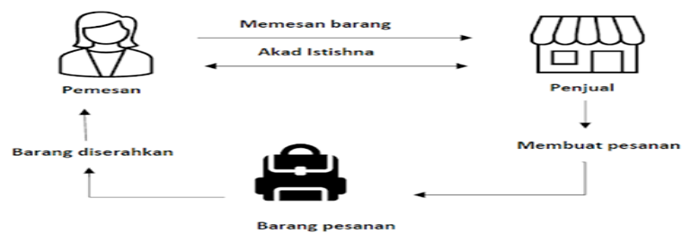
Gambar 4. Skema Penerapan Akad Istishna dalam Transaksi Jual-Beli