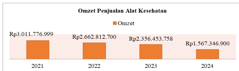
Gambar 3. Grafik Omzet Penjualan Alat-Kesehatan Periode 2021 – 2024

Seiring dengan berjalannya waktu, pada tahun 2012 perusahaan ini memulai untuk menambahkan produk jual-belinya dalam bidang manufaktur. Bahan mentah yang diolah sehingga menghasilkan industri primer. Perkembangan teknologi sangat membantu dalam pengelolaannya memproduksi bahan tersebut hingga menjadi suatu barang, dengan menggunakan mesin salah satunya mesin gerinda. Bidang manufaktur ini termasuk salah satu produk jual-beli dengan minat terbanyak. Salah satu karyawan terlama yang bekerja di perusahaan ini adalah Firman Samsul sebagai pegawai yang mengerjakan jasa manufaktur tersebut. Beberapa produk tersebut di antaranya adalah tempat tidur periksa pasien, instrumen troli, tempat tidur bekam, standar baskom, troli emergency , partus bed atau tempat tidur untuk melahirkan.