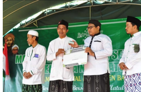
Gambar 4. Launching Kartu SANTAP