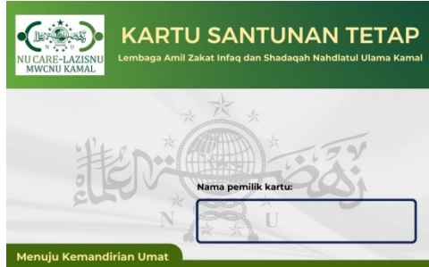
Gambar 3. Kartu SANTAP

Sumber: Hasil Desain Kegiatan Lapangan di Lembaga NU-CARE LAZISNU MWCNU Kamal