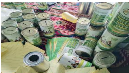
Gambar 1. Kaleng KOIN NU