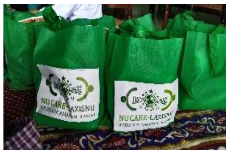
Gambar 4. Pentasyarufan hasil KOIN NU

Sasaran masyarakat yang dinyatakan sebagai penerima kartu SANTAP dapat di request -kan langsung dari para donatur KOIN NU, yang mana dari sini menggambarkan bahwa dana dari masyarakat Kecamatan Kamal akan dikembalikan lagi kepada masyarakat Kecamatan Kamal melalui penghimpunan dana dan pengelolaan dananya oleh lembaga NU-CARE LAZISNU MWCNU Kecamatan Kamal.