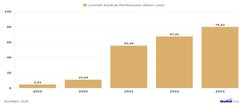
Gambar 2. Pertumbuhan Penggunaan Paylater di Indonesia (2019-2023)