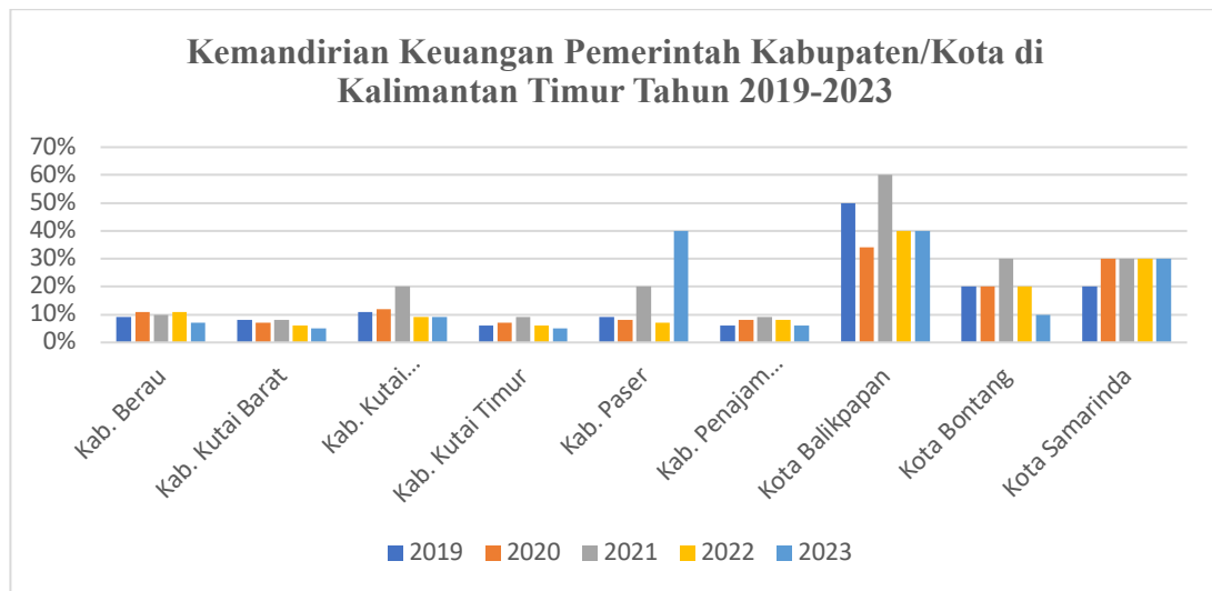
Gambar 1. Grafik Kemandirian Keuangan Pemerintah Kabupaten/Kota di Kalimantan Timur Tahun 2019-2023

merupakan data kemandirian keuangan pada Pemerintah Daerah Kabupaten/Kota di Kalimantan Timur Tahun 2019-2023 sebagai berikut: