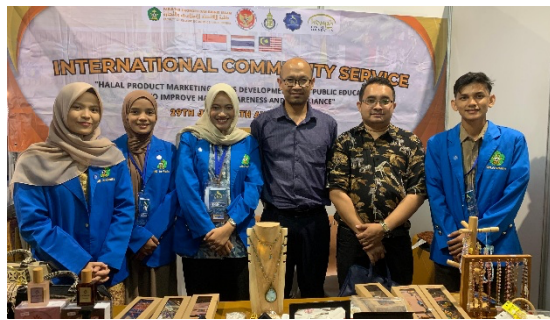
Gambar 3. Memasarkan Produk kepada Pihak Universitas Utara Malaysia