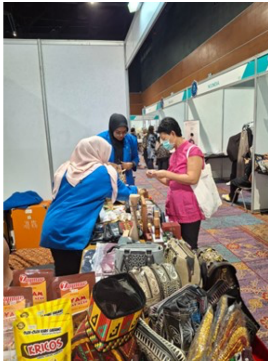
Gambar 6. Memasarkan Halal Product UMKM Aceh kepada Masyarakat Hatyai Thailand