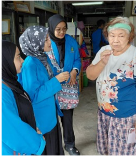
Gambar 2. Pengenalan Produk Makanan UMKM Khas Aceh