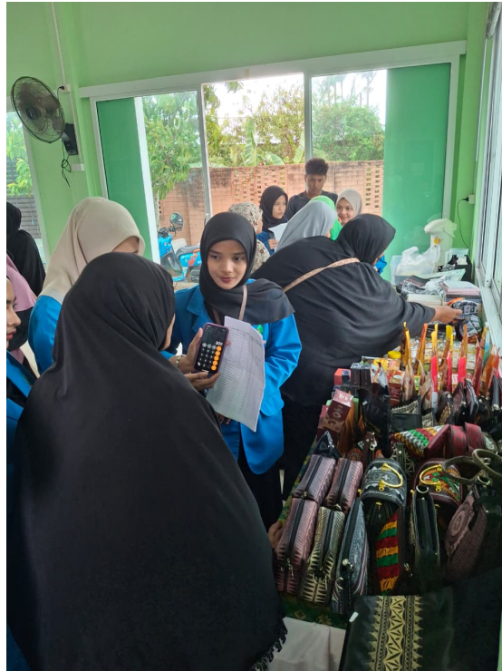
Gambar 4. Memasarkan dan Mengenalkan Produk UMKM Aceh pada Masyarakat Songkhla Thailand