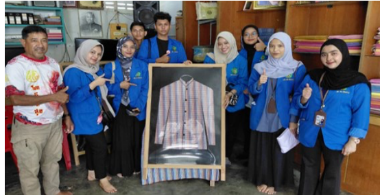
Gambar 5. Mengunjungi Produk UMKM Hatyai Thailand Produksi Tenun