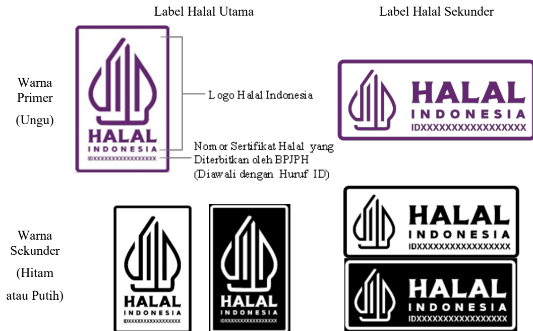
Gambar 2. Panduan Penggunaan Label Halal Indonesia

Pemerintah telah menuangkan ketentuan pencantuman label halal dalam suatu peraturan resmi, hal ini tentu menjadi kewajiban pelaku usaha yang telah bersertifikat halal untuk mencantumkan label halal sebagaimana peraturan yang ditetapkan. Pengawasan label halal yang dilakukan Pendamping PPH sebagai bentuk pelaksanaan Pasal 95 Poin D Peraturan Pemerintah Nomor 39 Tahun 2021 yang berbunyi “BPJPH melakukan pengawasan terhadap JPH. Pengawasan JPH dilakukan terhadap: d. Pencantuman label halal”. Dikeluarkannya peraturan tersebut menunjukkan bahwa pencantuman label halal menjadi hal yang penting agar pelaku usaha dapat mencantumkan label halal yang sesuai standar sebagaimana dalam Keputusan Kepala BPJPH Nomor 145 Tahun 2022 tentang Penggunaan Logo Halal dan Label Halal pada Produk yang Telah Memperoleh sertifikat Halal. Kompetensi Pendamping PPH dalam mekanisme self-declare mulai tahap verval hingga pengawasan merupakan faktor krusial karena Pendamping PPH merupakan pihak yang memiliki tanggung jawab dalam melakukan verifikasi dan validasi (verval) kehalalan produk serta membimbing pelaku UMKM dalam memahami Sistem Jaminan Produk Halal (SJPH) (Lutfika et al., 2023).