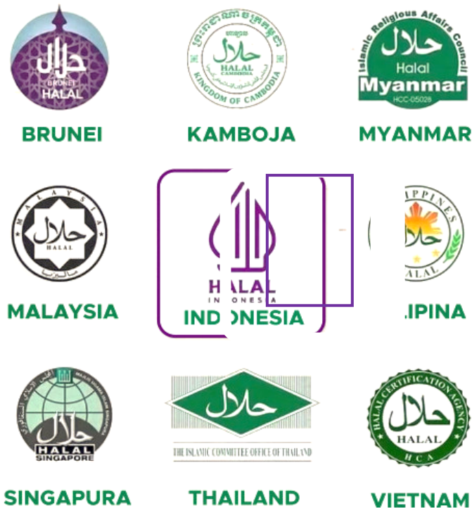
Gambar 3. Label Halal Negara-negara di Asia Tenggara