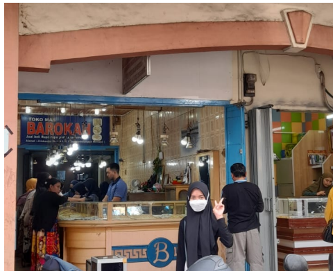
Gambar 1 1 Toko Emas Sinar Baru

Pada tabel di atas terlihat bahwa harga emas per gram dengan kadar 375 di Toko Emas Sinar Baru lebih murah dibandingkan dengan toko emas lain yang juga berlokasi di Gerai Ritel Mentaya (PPM). Namun, toko tersebut jarang dikunjungi pembeli, baik untuk berdagang batu permata. Bahkan kualitas perhiasan di Toko Sinar Baru ini benar-benar bagus dan kualitasnya setara dengan toko lainnya.