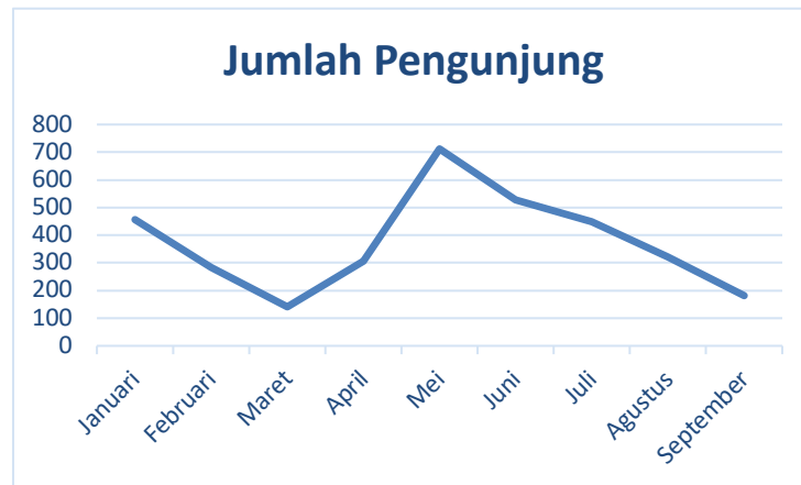
Gambar 1. Data Kunjungan pada Wisata Sarwono di Desa Wonosoco Kecamatan Undaan Kabupaten Kudus