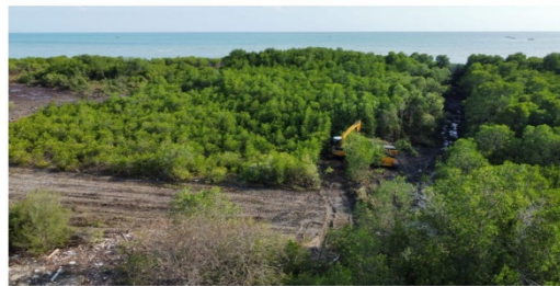
Kawasan mangrove di Desa Ambat, Kecamatan Tlanakan, Pamekasan, yang diduga telah dirusak.

Mangrove secara alami tumbuh di sepanjang pesisir Indonesia dan berfungsi sebagai pencegah abrasi pantai. Keberadaan hutan mangrove dapat meminimalisir pengikisan area pantai, terutama saat musim penghujan, serta menyediakan ekosistem bagi kepiting dan berbagai jenis ikan lainnya. Namun, dalam perkembangan pembangunan, seringkali hutan mangrove dialihfungsikan dan dihancurkan demi kepentingan pembangunan oleh individu maupun perusahaan pengembang. Salah satu contoh kasus yang terjadi adalah di Desa Ambat, Kabupaten Pamekasan, di mana ekosistem mangrove di sepanjang pantai desa tersebut dihancurkan oleh pihak-pihak yang tidak bertanggung jawab untuk mengejar keuntungan pribadi. Padahal, dalam Undang-Undang tentang pengelolaan pesisir, hutan mangrove seharusnya dilindungi.