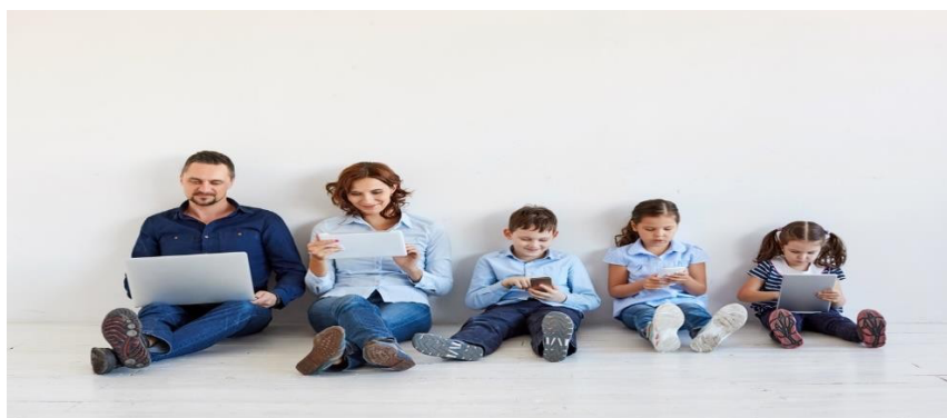
Gambar 1. Keluarga Sedang Bermain Smartphone

Perilaku masyarakat, termasuk perilaku keluarga, dapat dipengaruhi oleh kemajuan teknologi informasi dan komunikasi. Setiap keluarga memiliki bentuk, ukuran, dan cara berinteraksi dan berkomunikasi yang berbeda, menurut Wood (2016: 352). Oleh karena itu, setiap keluarga menghadapi tantangan tertentu dalam menciptakan komunikasi yang baik; keluarga dengan orang tua yang bekerja menghadapi masalah yang berbeda dengan keluarga lain dalam hal menciptakan komunikasi dalam keluarga. Komunikasi keluarga yang baik dapat dibangun oleh setiap anggota keluarga, baik orang tua maupun anak, dan ini dapat dilihat dari aktivitas yang dilakukan oleh setiap anggota keluarga dan Foss, 2009: 384).