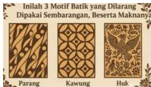
Gambar 1. Komentar Netizen yang baru mengetahui motif batik yang ternyata dilarang dipakai secara sembarangan