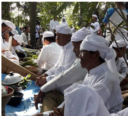
Gambar 3. Pakain Putih dan Jamuan Nasi Jagung dalam Upacara Adat Ngasa

Selain itu, penggunaan pakaian serba putih dalam perayaan Upacara Adat Ngasa menjadi simbol penting yang mengandung makna religius dan spiritual. Warna putih dimaknai sebagai lambang kesucian, ketulusan, dan kedekatan manusia dengan Sang Pencipta, sehingga memperkuat dimensi sakral dari ritual tersebut. Selain itu, penggunaan pakaian serba putih dalam perayaan Upacara Adat Ngasa menjadi simbol penting yang mengandung makna religius dan spiritual. Warna putih dimaknai sebagai lambang kesucian, ketulusan, dan kedekatan manusia dengan Sang Pencipta, sehingga memperkuat dimensi sakral dari ritual tersebut (Turyati & Sriwardani, 2020).