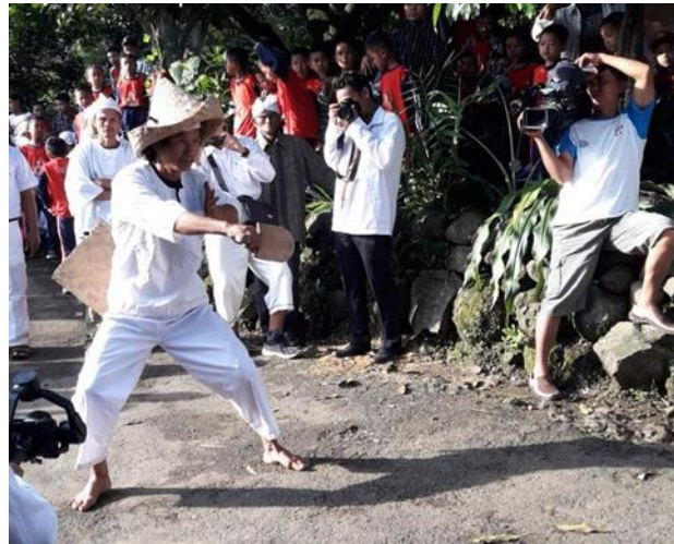
Gambar 1. Upacata Adat Ngasa

berkontribusi signifikan terhadap peningkatan daya saing destinasi berbasis komunitas.