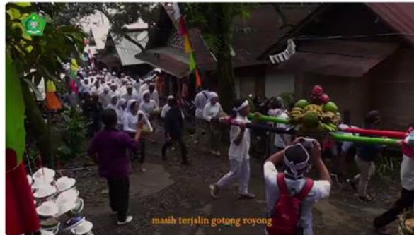
DOKUMENTER NGASA MID JAVA | KAMPUNG ADAT JALAWASTU DESA CISEUREH KEC. KETANGGUNGAN KAB. BREBES