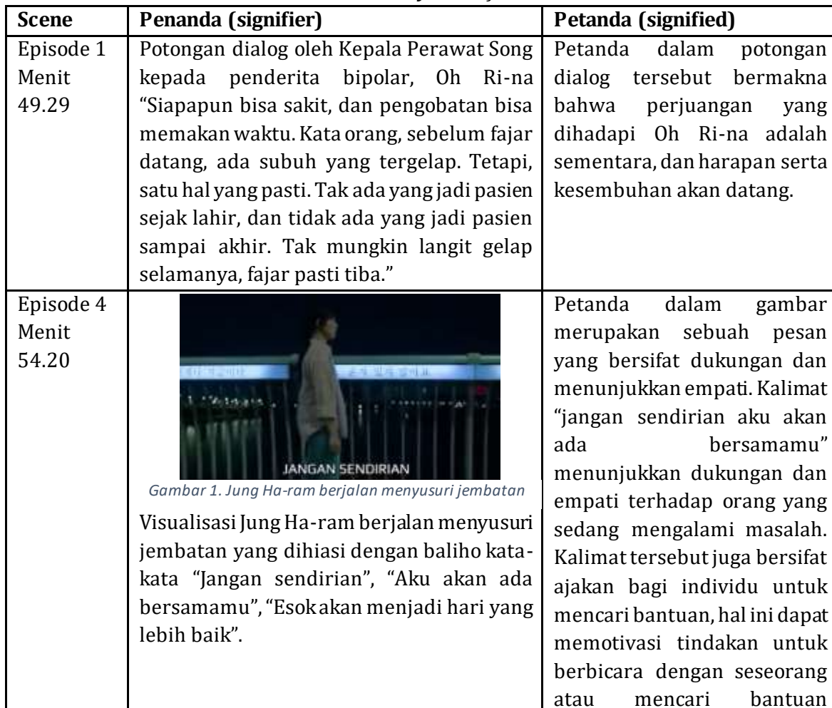
Table 1 Penanda dan Petanda Komunikasi Persuasif terkait Kesadaran Kesehatan Mental dalam Series Daily Dose of Sunshine

Hasil penelitian yang ditemukan dalam series ini berasal dari analisis yang dilakukan menggunakan metode analisis semiotika Ferdinand De Saussure dengan membagi ke dalam bentuk penanda dan petanda. Berikut ini akan diuraikan 15 adegan dari series Daily Dose of Sunshine episode 1 hingga 11 berupa tangkapan layar dan potongan dialog yang mengandung komunikasi persuasif terkait kesehatan mental.