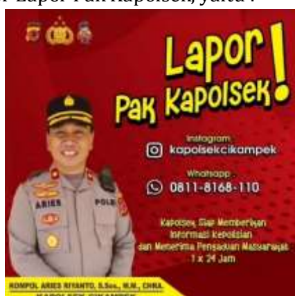
Gambar 2 Poster Lapor Pak Kapolsek

Polsek Cikampek baru-baru ini meluncurkan program inofatif, program tersebut diberi istilah 'Lapor Pak Kapolsek'. Program tersebut dirancang dalam upaya membentuk implementasi Polri Presisi dalam meningkatkan pelayanan pengaduan cepat kepada masyarakat dan juga membuka ruang komunikasi antara kepolisian dengan masyarakat. Berikut ini Gambar 2 Poster Lapor Pak Kapolsek, yaitu :