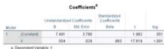
Gambar 4 Hasil Uji T

Dari hasil perhitungan normalitas yang sudah dilakukan, diperoleh hasil dengan taraf signifikan yang telah ditentukan yaitu 0,05. Pengujian tersebut menunjukkan bahwa nilai signifikan sebesar 0,69 karena nilai signifikan 0,69 > 0,05, maka dapat disimpulkan bahwa data dalam penelitian ini berdistribusi normal.