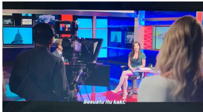
Gambar 11. Scene shooting berita