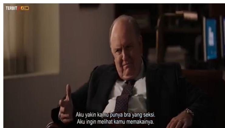
Gambar 17. Scene Roger berbincang dengan Megyn

Perilaku yang ditampilkan mencerminkan seorang bawahan yang sedang menyesal dan sedih hal ini ditunjukkan dengan perilaku usapan air mata yang berlinang sambil menangis sesenggukan menjelaskan apa yang telah terjadi padanya. Lingkungan yang ditampilkan yaitu di luar tempat makan sambil bersandar pada bangunan samping jalan raya. Ditampilkan Kayla yang berdiri di luar bangunan sambil bersandar di bangunan dan berbicara di telepon dengan sesekali mengusap air matanya. Pencahayaan yang digunakan yaitu Side lighting menggunakan teknik pencahayaan yang memanfaatkan arah cahaya yang datang tepat dari samping objek sehingga, posisi jatuhnya bayangan berada pada posisi lainnya. Musik yang digunakan dalam scene ini adalah direct sound yakni menggunakan suara yang diproduksi sendiri yang direkam dalam set atau lokasi. Suara yang ditampilkan adalah suara Kayla yang sedang menyesal atas apa yang telah dia perbuat sambil menangis saat bercerita di telepon. Teknik cut pada scene ini menunjukkan transisi adegan serta bertujuan agar penonton dapat fokus pada gerakan dan ekspresi Kayla serta tindakan yang sedang dilakukan Kayla dengan mengusap air matanya.