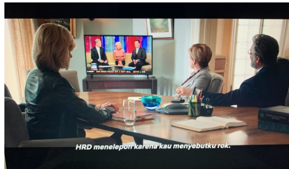
Gambar 6. Scene Tiga orang sedang menonton potongan berita