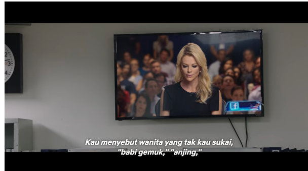
Gambar 3. Megyn Kelly sedang membawakan acara

ditampilkan dengan menunjukkan gestur panik karena dihujat oleh bosnya. Pengambilan gambar dengan teknik close up pada saat staf wanita menerima telepon memperjelas ekspresi dan mimik panik dalam scene ini.