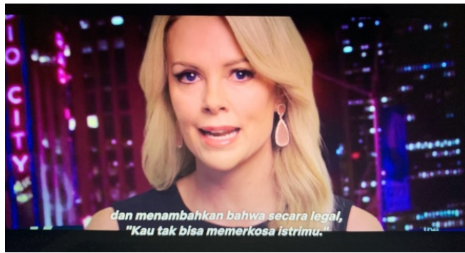
Gambar 1. Scene Megyn Kelly membawakan Berita

Dalam potongan scene ini terdapat makna bahwa meskipun menjalin hubungan suami – istri secara legal dimata negara, apabila dalam melakukan hubungan badan ( sex ) masih terdapat unsur paksaan kepada salah satu pihak. Maka, hal tersebut, sama dengan melakukan kekerasan seksual kepada pasangan. Dalam scene ini Megyn nampak menggunakan dress hitam dengan aksesoris anting. Menunjukkan gerak tubuh yang tegas. Penggunaan dress ini menunjukkan kesan formal dan status sosial. teknik yang digunakan dalam scene ini bertujuan agar para penonton atau khalayak dapat fokus memperhatikan Megyn yang sedang membawakan berita tersebut. Penyampaian berita yang ditampilkan oleh Megyn menggambarkan keseriusan dalam pengambilan scenanya karena diambil dari permasalahan politik yang sedang terjadi di Amerika Serikat. Teknik cut dalam scene ini bertujuan agar penonton atau khalayak dapat fokus kepada penyampaian topik dan ekspresi Megyn.