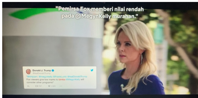
Gambar 5. Scene Megyn berjalan memasuki gedung Fox News

kekerasan seksual, Lentera Sintas Indonesia, bekerja sama dengan wadah petisi daring Change.org dan media perempuan, menunjukkan bahwa pelecehan seksual secara verbal menjadi jenis kekerasan seksual paling umum terjadi. teknik kamera yang digunakan point of view , dengan pencahayaan bounce lighting dimana pada scene ini diperlihatkan suasana ruang kantor fox news . Pada scene ini bertujuan agar para penonton mengamati ekspresi kaget dua staff kantor fox news . Musik yang digunakan dalam scene ini yaitu direct sound . Suara yang ditampilkan berasal dari televisi yang sedang menampilkan berita. Teknik dissolve yang digunakan pada scene ini menunjukkan perubahan shot dari suasana kantor fox news menjadi ruang siaran fox news .