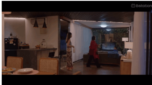
Gambar 3.1: Ibu mertua Ambar berkunjung ke rumahnya (23:09)

perempuan, melainkan juga menjadi tugas dan tanggung jawab laki-laki untuk dapat menghilangkan peran ganda akibat dari stereotip tradisional yang dapat merugikan seseorang.