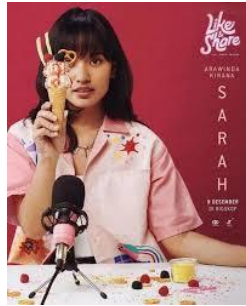
Gambar 4. 3 Karakter Sarah