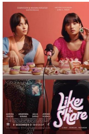
Gambar 4. 1 Poster Film Like And Share