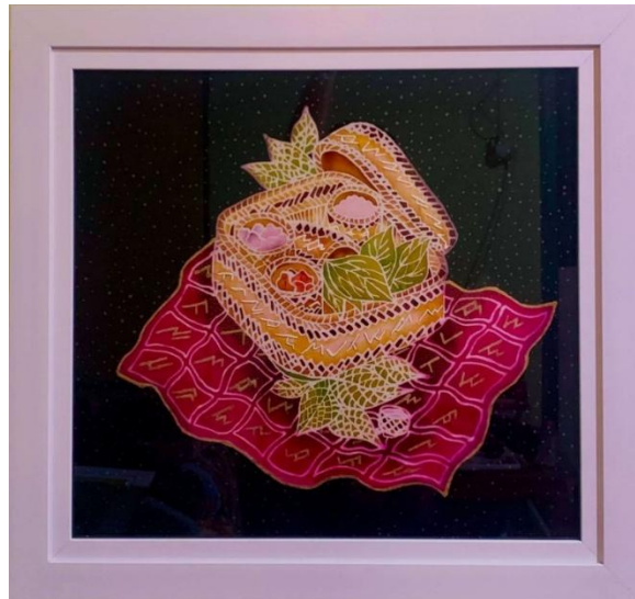
Gambar 22. Bokoa Iben