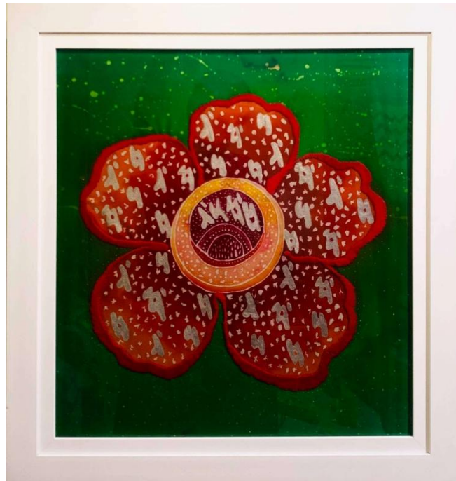
Gambar 24. Rafflesia