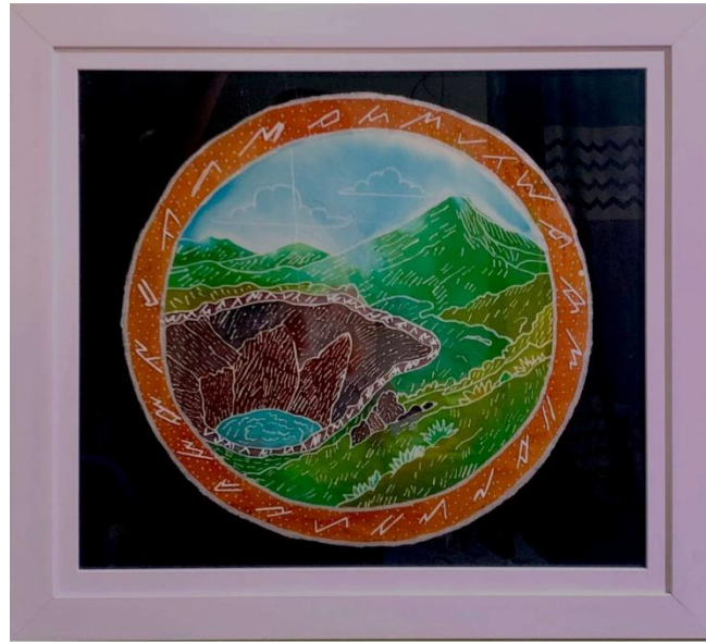
Gambar 28. Bukit Kaba