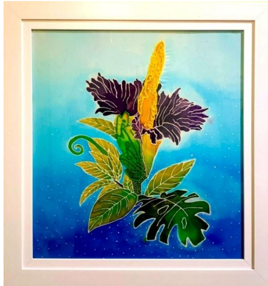
Gambar 23. Bunga Kibut