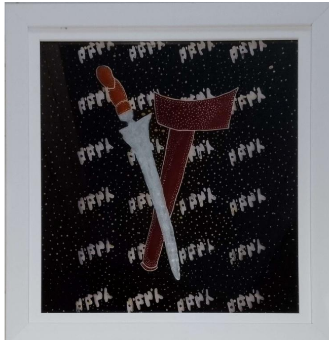
Gambar 25. Keris Rejang