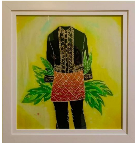
Gambar 26. Baju Adat Rejang