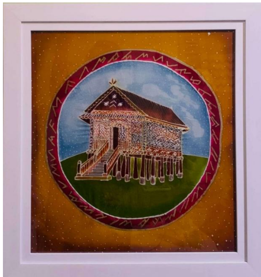
Gambar 21. Rumah Adat Rejang