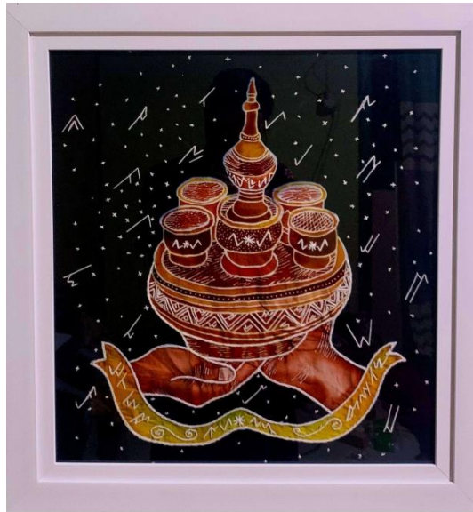
Gambar 30. Cerano