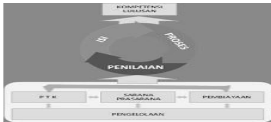
Gambar 1. Hubungan Antar Standar dalam SNP