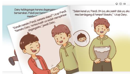
Gambar 3. Pengembangan

Perancangan media cerita anak dalam memastikan bahwa media yang dibuat sesuai dengan desain awal dan mampu mendukung tujuan pembelajaran. Melalui tahap pengembangan yang baik, diharapkan media cerita anak berbasis E-Book dapat memberikan kontribusi positif dalam proses pembelajaran dan meningkatkan pemahaman siswa terhadap materi yang diajarkan.