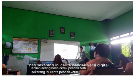
Gambar 4. Implementasi