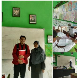
Gambar 2. Analisi dan Observasi

Pada tahap ini peneliti melakukan analisis observasi awal di SDN Dalpenang 3 Sampang. Pada saat melakukan observasi terdapat suatu permasalahan yang dimana media pembelajaran yang digunakan oleh guru kurang menarik bagi siswa, terutama karena masih mengandalkan buku siswa yang hanya berisi teks. Hal ini menyebabkan siswa merasa bosan saat membaca teks dan kurang termotivasi. Dampaknya, minat baca siswa menurun dan mereka mengalami kesulitan menentukan struktur kalimat yang ada di materi bahkan ada peserta didik yang tidak dapat membedakan mana objek dan mana predikat. Untuk mengenal bagaimana kemampuan peserta didik untuk menggunakan digital dan memberikan materi pembelajaran yang diringkas untuk dijadikan bahan media yang simpel.