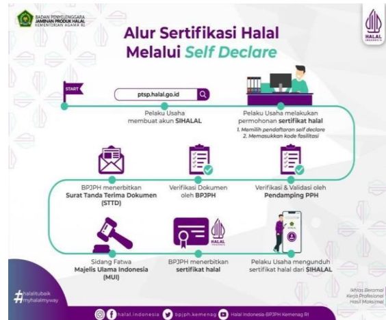
Gambar 1. Alur Sertifikasi Halal.

Secara alur pengajuan sertifikat halal dimulai dengan pelaku usaha mikro kecil yang harus membuat akun di website SiHalal. Setelah itu, mereka mendaftarkan sertifikat halal yang kemudian diverifikasi oleh pendamping untuk memastikan kehalalan produknya. Selanjutnya, dokumen tersebut akan diverifikasi oleh Badan Penyelenggara Jaminan Produk Halal (BPJPH) dan diikutkan dalam proses sidang fatwa. BPJPH akan mengeluarkan sertifikat halal, yang hasilnya akan diterima oleh pelaku usaha mikro kecil.