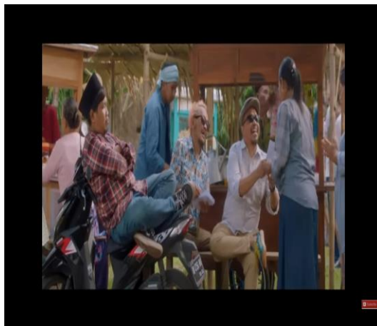
Gambar 4. Cuplikan Adegan Simbol Serangan Fajar