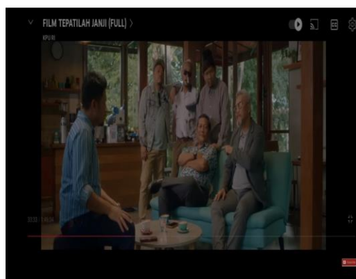
Gambar 6. Cuplikan Adegan Simbol Perjanjian dengan Partai

Simbol ini menampilkan adegan calon pemimpin Adam yang melakukan perjanjian dengan partai ungu. Partai ini, pernah menjadi partai yang melakukan penyalahgunaan dana. Dalam perjanjian dengan partai mengakibatkan permasalahan-permasalahan dalam kehidupan politik Adam karena ia terpengaruh dengan janji manis partai ungu. Secara denotasi, perjanjian dengan partai adalah kesepakatan atau persetujuan formal yang dibuat antara dua pihak atau lebih. Secara konotasi, simbol ini mengartikan calon pemimpin Adam berkoalisi dengan partai politik dalam dinamika kekuasaan, seperti strategi politik, kerja sama, dan kesepakatan bersama untuk mencapai kemenangan politik. Mitosnya bahwa semua orang yang terobsesi dengan kekuasaan politik akan bertindak segala cara untuk mendapatkan kemenangan, salah satunya bergabung dengan pihak penguasa demi mendapatkan keuntungan. Berikut ini adalah cuplikan adegan calon pemimpin Adam dalam melakukan perjanjian dengan partai.