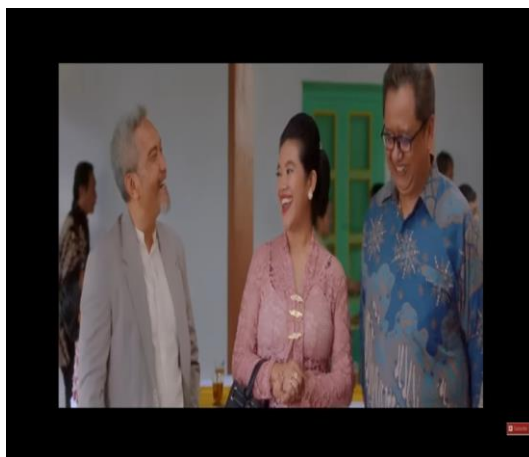
Gambar 1. Cuplikan Adegan Politik Dinasti