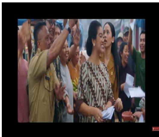
Gambar 3. Cuplikan Adegan Simbol Kampanye Politik (Calon Pemimpin Berbagi Uang di Pasar)

“Hari ini saya akan bagi-bagi bantuan sosial buat Bapak bapak dan Ibu-ibu semuanya.”