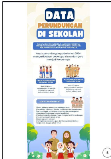
Gambar 5. Halaman Teks Multimodal Infografis

Pada halaman teks multimodal teks naratif dibuat menggunakan aplikasi Canva. Penulisan judul menggunakan font Funtastic. Ukuran font pada judul memiliki ukuran, warna dan latar tulisan yang berbeda-beda berikut deskripsi ukuran, warna dan latar tulisan: