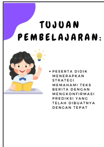
Gambar 2. Halaman Tujuan Pembelajaran

Pada halaman tujuan pembelajaran dibuat dengan menggunakan aplikasi Canva. Penulisan judul dalam halaman tujuan pembelajaran menggunakan font Chewy, berukuran 55,5, huruf kapital, dan berwarna hitam. Deskripsi tujuan pembelajaran menggunakan font Montserrat Classic, berukuran 20,3, huruf kapital, dan berwarna hitam.