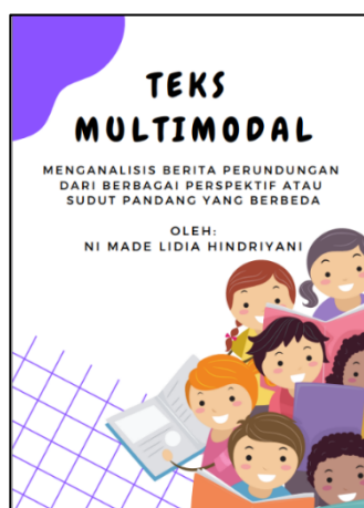
Gambar 1. Sampul Produk

Pada halaman sampul ini dibuat dengan menggunakan aplikasi Canva. Penulisan judul sampul ditulis dengan font Chewy, berukuran 55,5, huruf