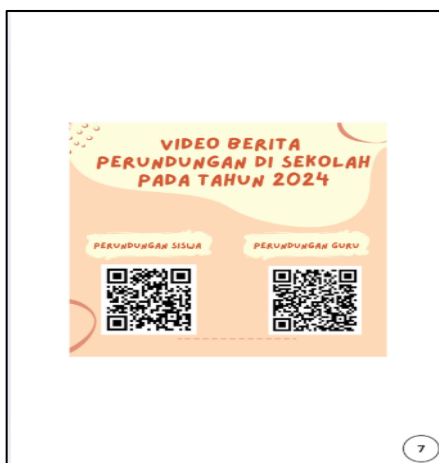
Gambar 6. Halaman Teks Multimodal Video Informatif berupa Barcode

Pada halaman teks multimodal video informatif berupa barcode dibuat menggunakan aplikasi Canva. Penulisan bagian judul dengan menggunakan font Lazydog, berukuran 57, dan berwarna coklat. Bagian judul materi menggunakan font Lazydog, berukuran 23, dan berwarna coklat. Bagian barcode dibuat berwarna hitam putih dengan ukuran lebar dan tinggi 320. Latar barcode menggunakan warna merah muda dengan kombinasi hiasan abstrak berwarna coklat muda, dan coklat tua.