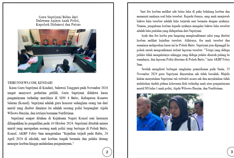
Gambar 4. Halaman Teks Multimodal Naratif

Pada halaman teks multimodal teks naratif dibuat menggunakan aplikasi Canva. Penulisan judul teks dibuat dengan font Times New Roman, berukuran 20, huruf kapital, dan berwarna hitam. Setelah, penulisan judul diberikan visual berupa kegiatan persidangan.