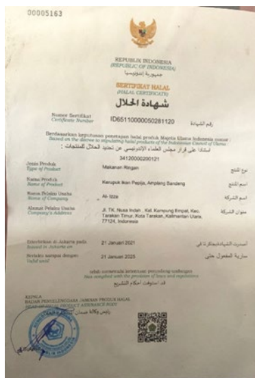
Gambar 1 Sertifikat Halal UMKM Al-Izza

UMKM Al-Izza merupakan usaha di bidang pengolahan pangan hasil perikanan yang menawarkan tiga produk makanan unggulan: kuku macan amplang bandeng, keripik ikan pepija, dan keripik ikan seruyuk sungai. Produk-produk dari UMKM ini menjadi daya tarik bagi banyak konsumen karena kualitas rasa yang lezat dan variasi rasa yang beragam, yang dapat disesuaikan dengan preferensi pelanggan.