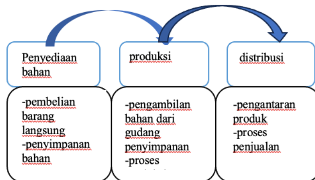
Gambar 3 proses HSCAM UMKM Al-Izza

Berikut ini adalah gambaran dari tahapan kegiatan dari pelaksanaan halal supply chain management pada UMKM Al-Izza berdasarkan hasil kegiatan wawancara dan observasi langsung pada lokasi usaha :