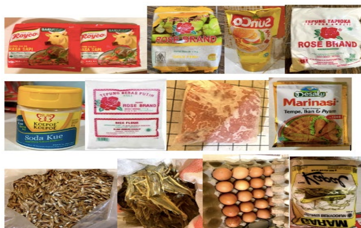
Gambar 4 Produk Bahan Yang Digunakan UMKM Al-Izza

Soda kue atau sering dikenal baking soda dibutuhkan sebagai pengembang adonan, yang dikarenakan mengandung zat ragi kimia yang dapat membuat adonan mengembang. Soda kue digunakan untuk adonan amplang produk UMKM Al-izza. Soda kue yang digunakan bermerek Kepo e-Koepoes produksi PT. Gunacipta Multirasa.