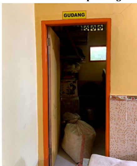
Gambar 8 Gudang penyimpanan