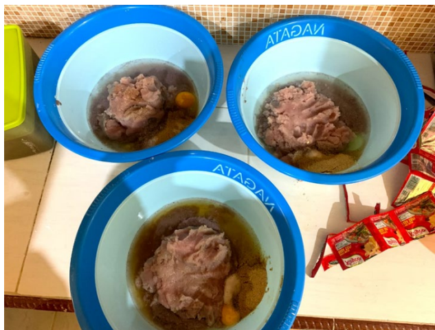
Gambar 9 Pencampuran bahan utama dan bahan tambahan

Kemudian dalam proses telur ini akan di pecahkan diwadah kemudian ditambahkan ikan bandeng fillet tanpa duri kemudian baru soda kue, gula, garam, royco, bumbu Desaku, minyak goreng dan air. Kemudian nanti akan ditambahkan bawang putih halus setelah itu tepung tapioca dan adonan diuleni sampai kalis, jika adonan kering tambahkan air sedikit.