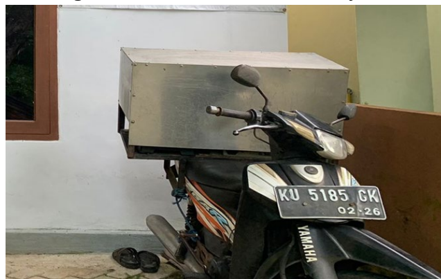
Gambar 4.12 Alat Transportasi

proses distribusi yang dilakukan oleh UMKM Al-Izza ini menggunakan alat transportasi menggunakan motor yang dilengkapi sebuah tempat buatan dari kayu dan dilengkapi saluminium serupa box yang nantinya ini digunakan untuk mengantar produk UMKM Al-Izza, yang dimana box itu sangat terlindungi dari cuaca panas dan hujan untuk menjaga kebersihan dan kelayakan produk yang akan di antar ke pelanggan dan yang akan ditempatkan beberapa toko di juwata laut. Alat distribusi yang digunakan juga bukan alat yang pernah digunakan untuk mengangkut bahab-bahan ataupun zat yang mengandung kotoran, bangkai, darah, dan zat haram lainnya.