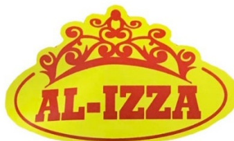
Gambar 2 Logo Usaha Al-Izza