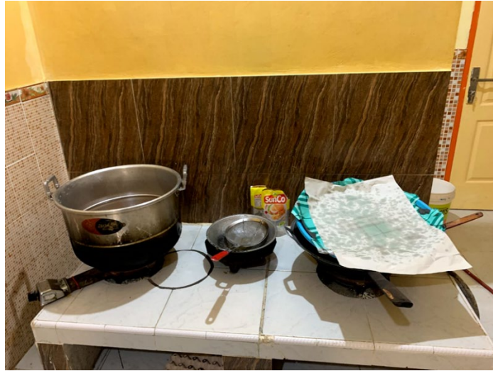
Gambar 10 Penggorengan