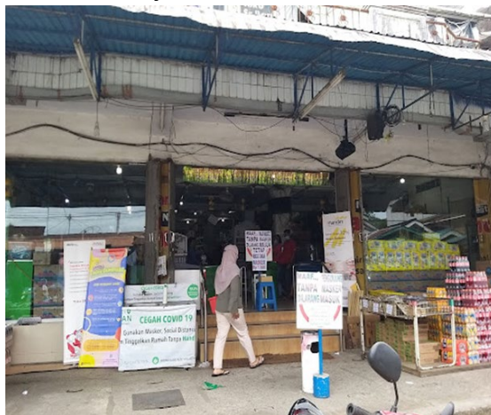
Gambar 5 Toko SR

Supplier yang dituju ini seperti penyediaan bahan baku ikan-ikan an diambil dari para nelayan yang ada dan menyediakan ikan bandeng tanpa duri, ikan seruyuk, ikan pepijah yang berlokasi kan di juwata laut. Kemudian supplier untuk penyedia bahan bantuan dan bahan tambahan yang pertama ada toko SR. Toko SR baru berada di Jl. Karang Anyar, Kecamatan Tarakan Barat, Kota Tarakan, Kalimantan Utara. Kemudian, yang ke dua ada toko srimarindo horeca foodgrade merupakan toko yang menyediakan kemasan yang berlokasikan Surabaya.