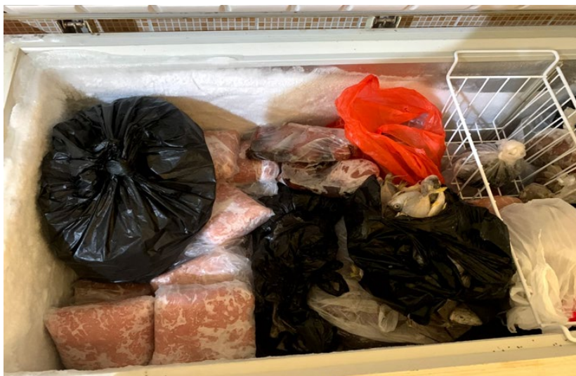
Gambar 7 Lemari pendingin