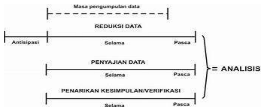
Gambar Komponensial Analisis Data Model Alir