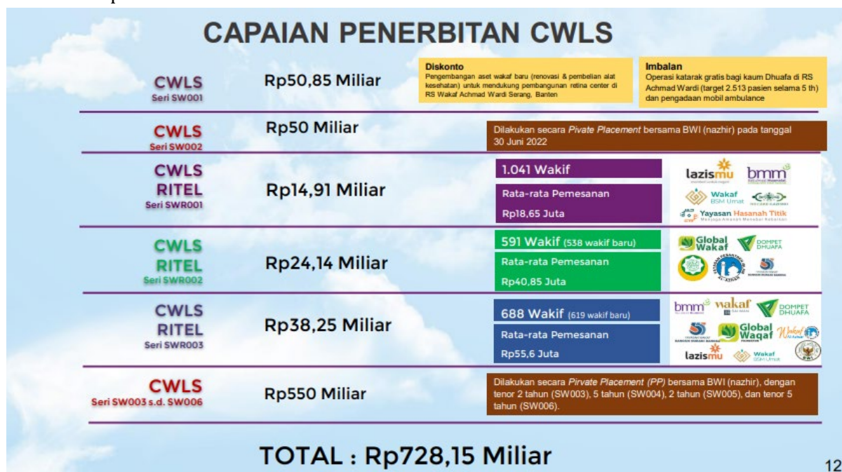
Gambar 2 Capaian Penerbitan Cash Waqf Linked Sukuk

Berikut ini adalah capaian penerbitan Cash Waqf Linked Sukuk sejak pertama kali diterbitkan pada tahun 2020 :