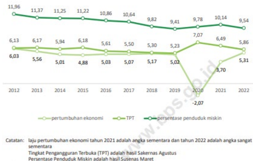
Gambar 1 Laju Pertumbuhan Ekonomi, Presentase Penduduk Miskin dan Tingkat Pengangguran Terbuka (Persen) 2012-2022