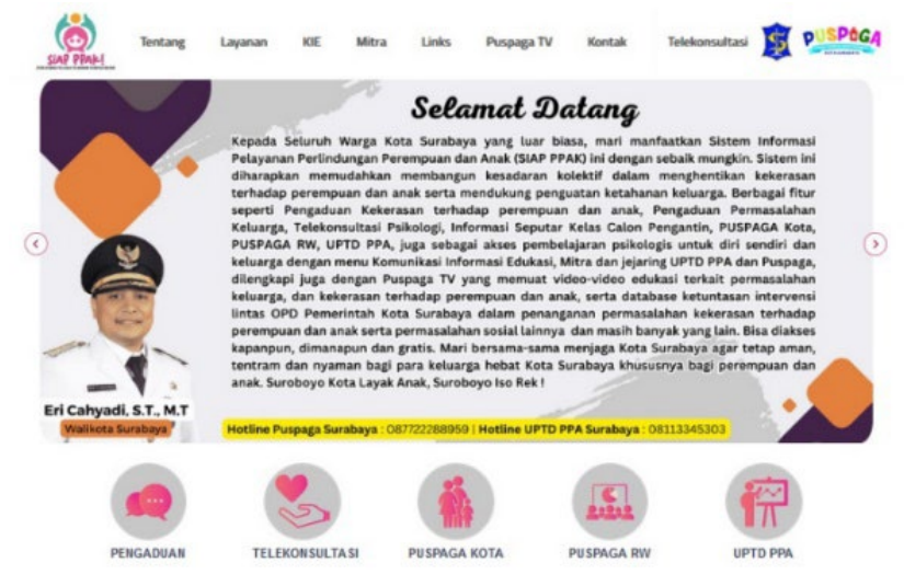
Gambar 2.1 (Tampilan Web/Aplikasi SIAP PPAK)

Dinas Pemberdayaan Perempuan Dan Perlindungan Anak Serta Pengendalian Penduduk dan Keluarga Berencana (DP3APPKB) dalam Program Puspaga di Kota