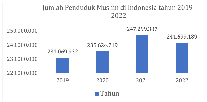
Gambar 1. Diagram batang jumlah penduduk muslim Indonesia tahun 2020-2022

Sumber: Satu Data Kementerian Agama Republik Indonesia, 2022.