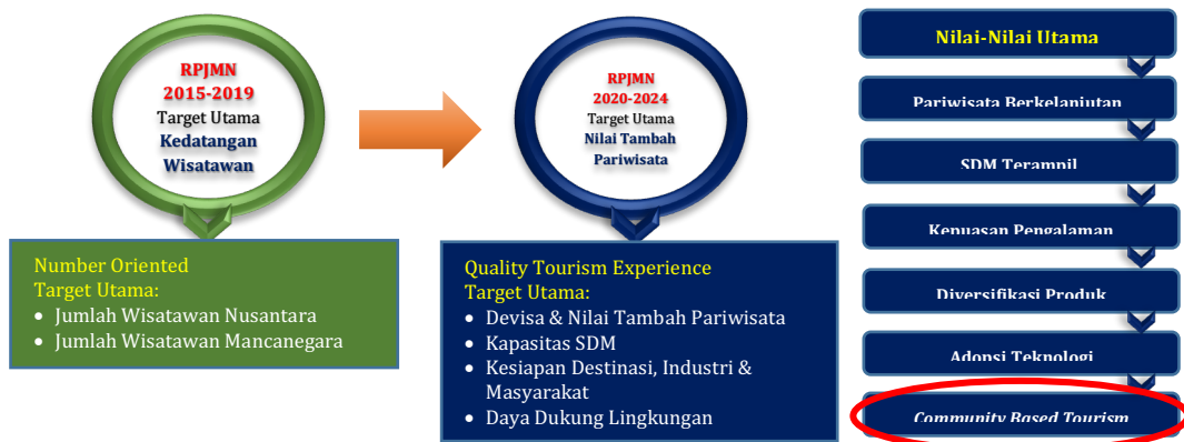
Gambar 1. Paradigma Pembangunan Pariwisata sesuai RPJMN 2020-2024

diarahkan untuk mengembangkan daya tarik wisata di tingkat desa melalui penyusunan rencana induk pengembangan daya tarik wisata atau masterplan (Peraturan Pemerintah RI, 2011).