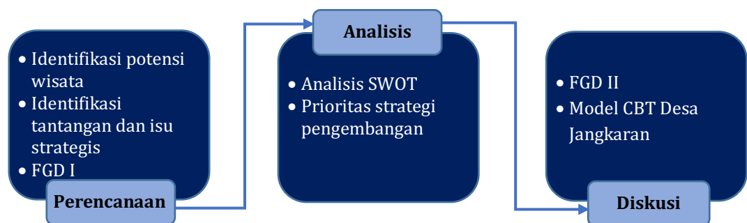
Gambar 3. Model Pengembangan CBT di Desa Jangkar

Dalam penelitian ini, terdapat tiga tahapan utama dalam mengidentifikasi model Community Based Tourism Desa Jangkar yaitu 1) Perencanaan; 2) Analisis; dan 3) Diskusi seperti tampak pada gambar 3.