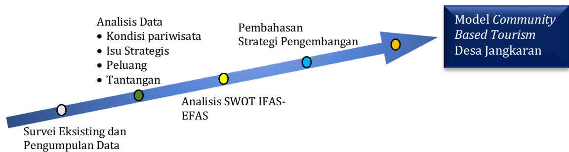
Gambar 2. Tahap Penelitian

hingga evaluasi akhir (Ballesteros & Portillo, 2024). Menurut Tarlani et al. (2022) semakin tinggi tingkat partisipasi masyarakat dalam pengembangan wisata, maka semakin besar peluang terciptanya pengelolaan pariwisata berkelanjutan dan pemberdayaan masyarakat lokal. Secara umum gambaran tahap penelitian disajikan pada gambar 2 sebagai berikut.